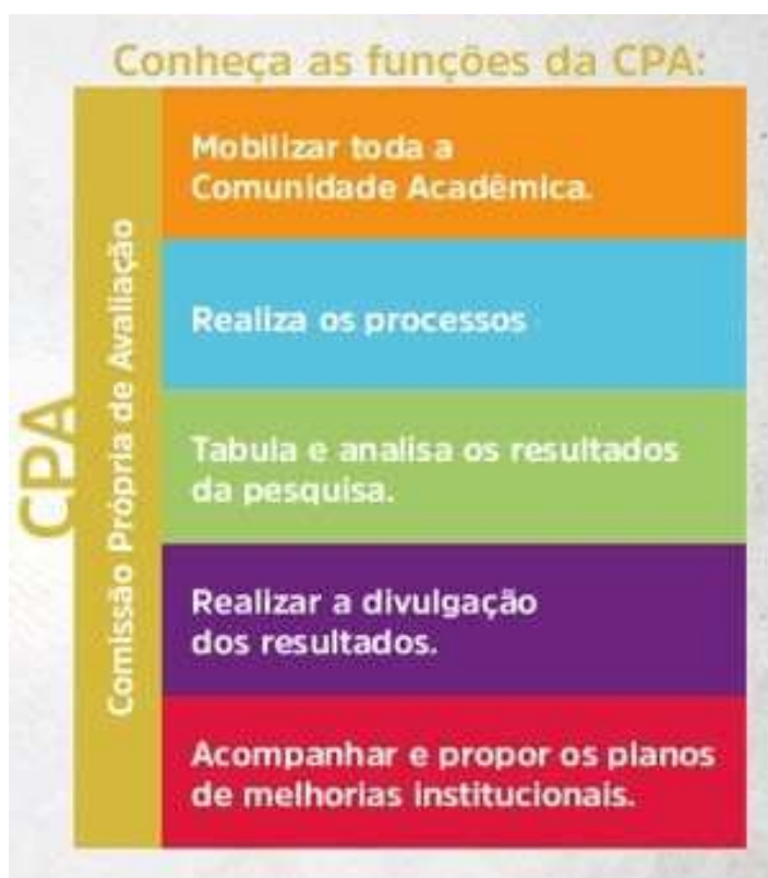
Figura 3 – Funções CPA