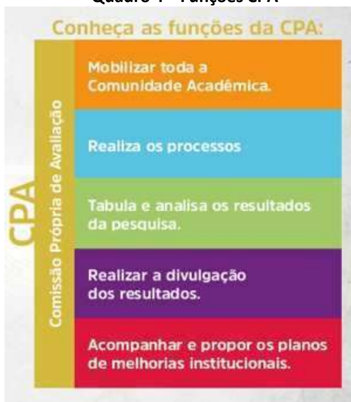
Quadro 4 – Funções CPA